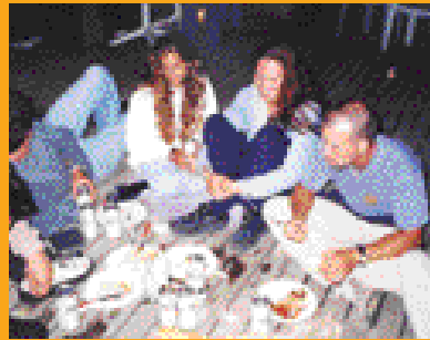
Mit dem Level-Club auf Tour